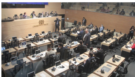
Projeto de lei do Executivo passou por duas votações

Um dia após a votação em primeira discussão, o Projeto de Lei do Executivo (PLE) número 8/2026, que dispõe sobre as diretrizes para elaboração e execução da Lei Orçamentária de 2027, foi aprovado de forma definitiva - a chamada segunda discussão - na reunião plenária da Câmara Municipal do Recife, realizada nesta terça-feira (30). Essa é a lei que estabelece as metas, prioridades e regras fiscais do governo para o ano seguinte, e tem duas funções: servir de base para a elaboração da Lei Orçamentária Anual (LOA), que orienta o orçamento do ano; e ajustar o Plano Plurianual (PPA), que contém as diretrizes de longo prazo aos recursos efetivamente disponíveis.