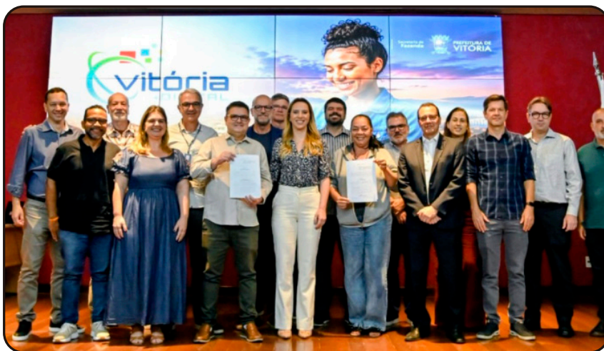
Lançamento do programa Vitória + Digital.

Para verificar a assinatura acesse o site http://diariooficial.vitoria.es.gov.br/ e utilize a chave DABBC46C-19B6-47DE-9A6D-A48A18492790