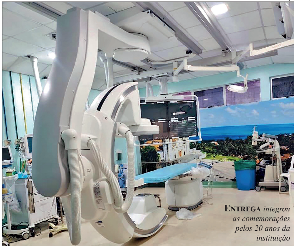
ENTREGA integrou as comemorações pelos 20 anos da instituição

Pernambuco avançou na ampliação da assistência cardiovascular da rede pública de saúde com a entrega, na sexta-feira, das novas salas A e B de hemodinâmica do Pronto-Socorro Cardiológico Universitário de Pernambuco (Procape), no Recife. Com investimento superior a R$ 8,4 milhões, a iniciativa moderniza o Centro de Hemodinâmica e Cardiologia Intervencionista da unidade e amplia a capacidade de realização de procedimentos cardiovasculares de alta complexidade. A entrega integrou as comemorações pelos 20 anos da instituição.