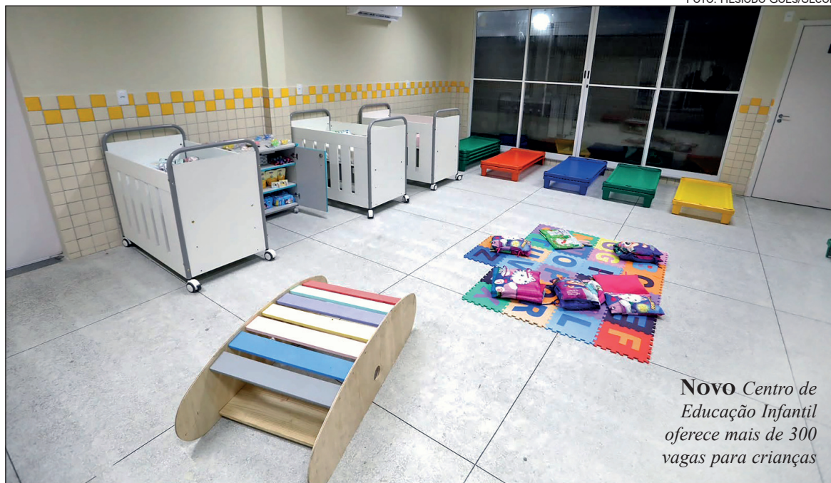
NOVO Centro de Educação Infantil oferece mais de 300 vagas para crianças

DESSALINIZADORES — O município também foi beneficiado com 10 novos sistemas de dessalinização instalados nas zonas rurais. Com investimento de aproximadamente R$ 2 milhões, o equipamento irá be-