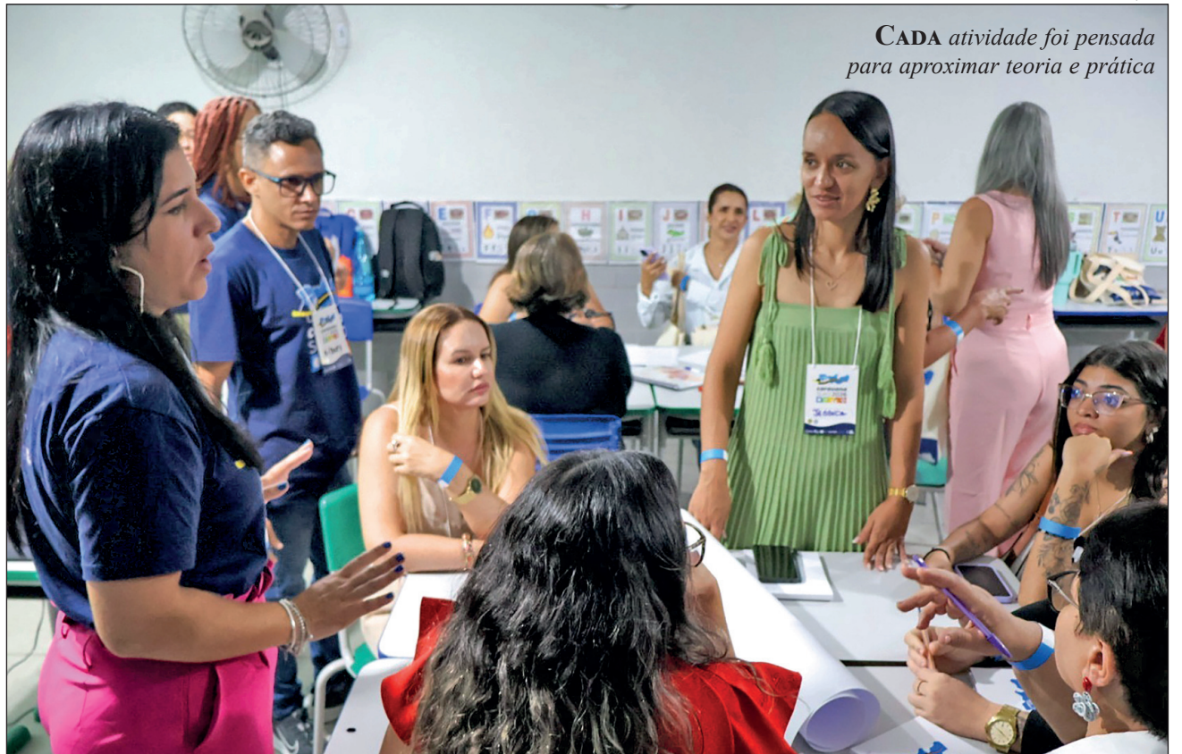
CADA atividade foi pensada para aproximar teoria e prática

Mais que encontros, a Caravana SUAS deixou