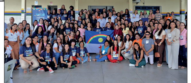
ENCONTROS e integrações reuniram quase dois mil profissionais

um legado de escuta, pactuação e fortalecimento da rede de proteção social. Cada região trouxe sua voz, mas todas se uniram em um só propósito: construir um Pernambuco mais justo, solidário e presente na vida de quem mais precisa.