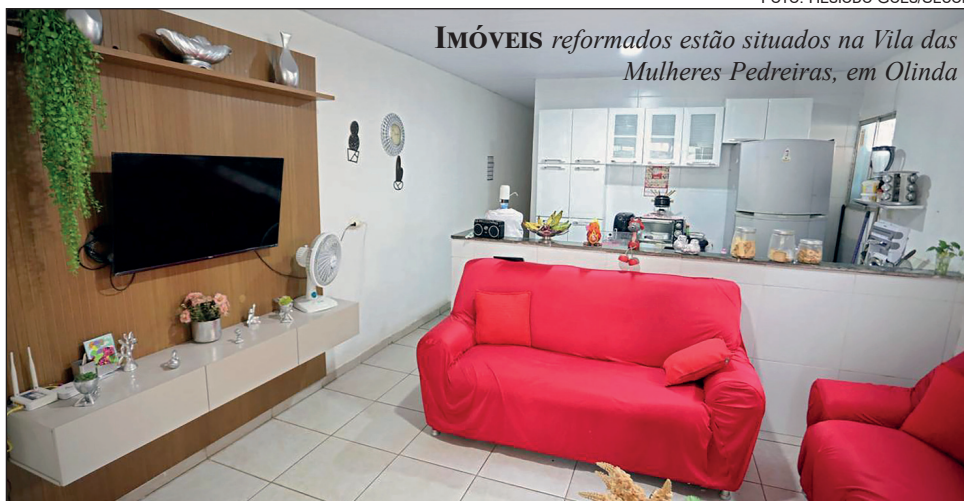
IMÓVEIS reformados estão situados na Vila das Mulheres Pedreiras, em Olinda

Por meio da Companhia Estadual de Habitação e Obras