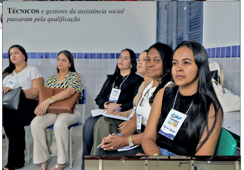
TÉCNICOS e gestores da assistência social passaram pela qualificação

um legado de escuta, pactuação e fortalecimento da rede de proteção social. Cada região trouxe sua voz, mas todas se uniram em um só propósito: construir um Pernambuco mais justo, solidário e presente na vida de quem mais precisa.