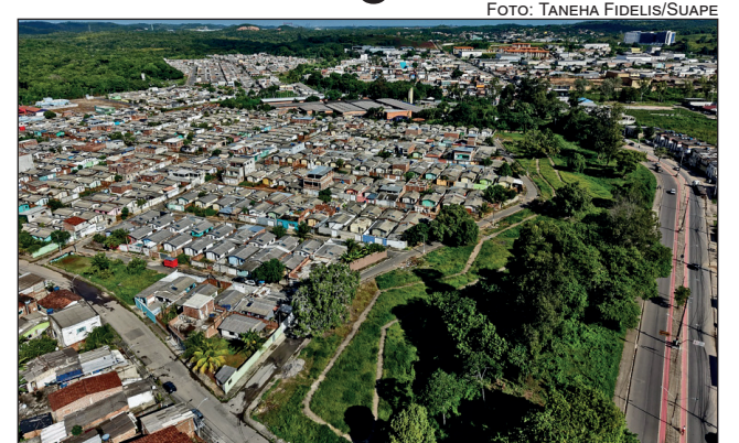
VISTA aérea das comunidades Nova Vila Claudete e Vila Claudete