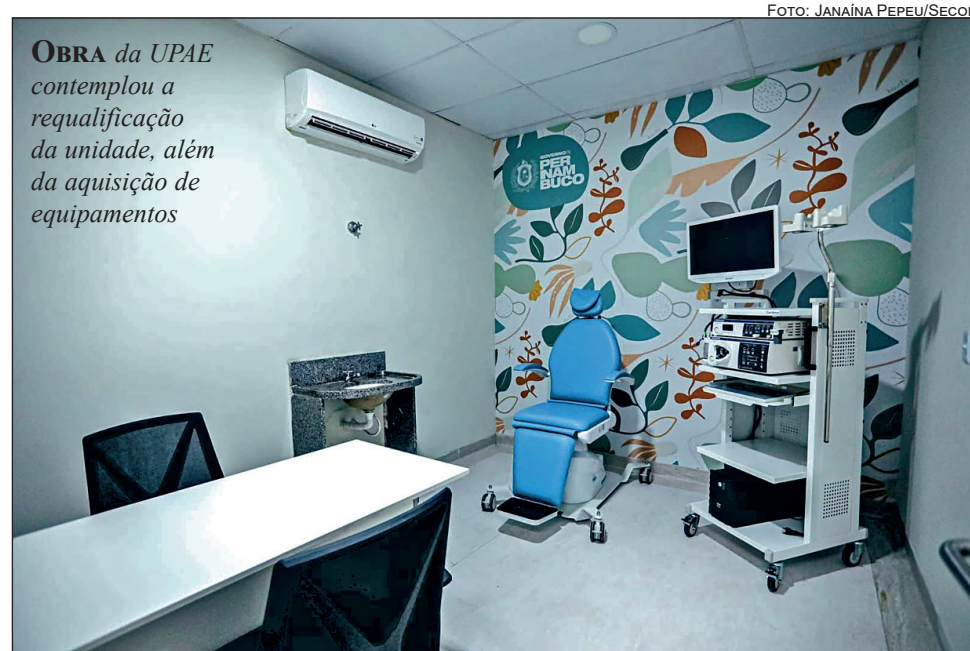
OBRA da UPAE contemplou a requalificação da unidade, além da aquisição de equipamentos

A nova emergência pediátrica do Hospital Belarmino Correia passa a contar com 13 leitos destinados ao atendimento de urgência pediátrica, sendo três leitos de Sala Ver-