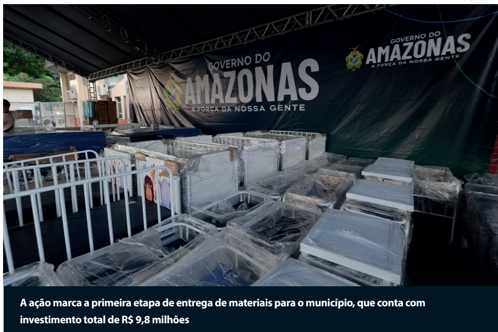
A ação marca a primeira etapa de entrega de materiais para o município, que conta com investimento total de R$ 9,8 milhões

recebeu mobiliários como armários, balanças pediátrica e antropométrica para pacientes obesos, microscópios, geladeiras, e equipamentos de escritório.