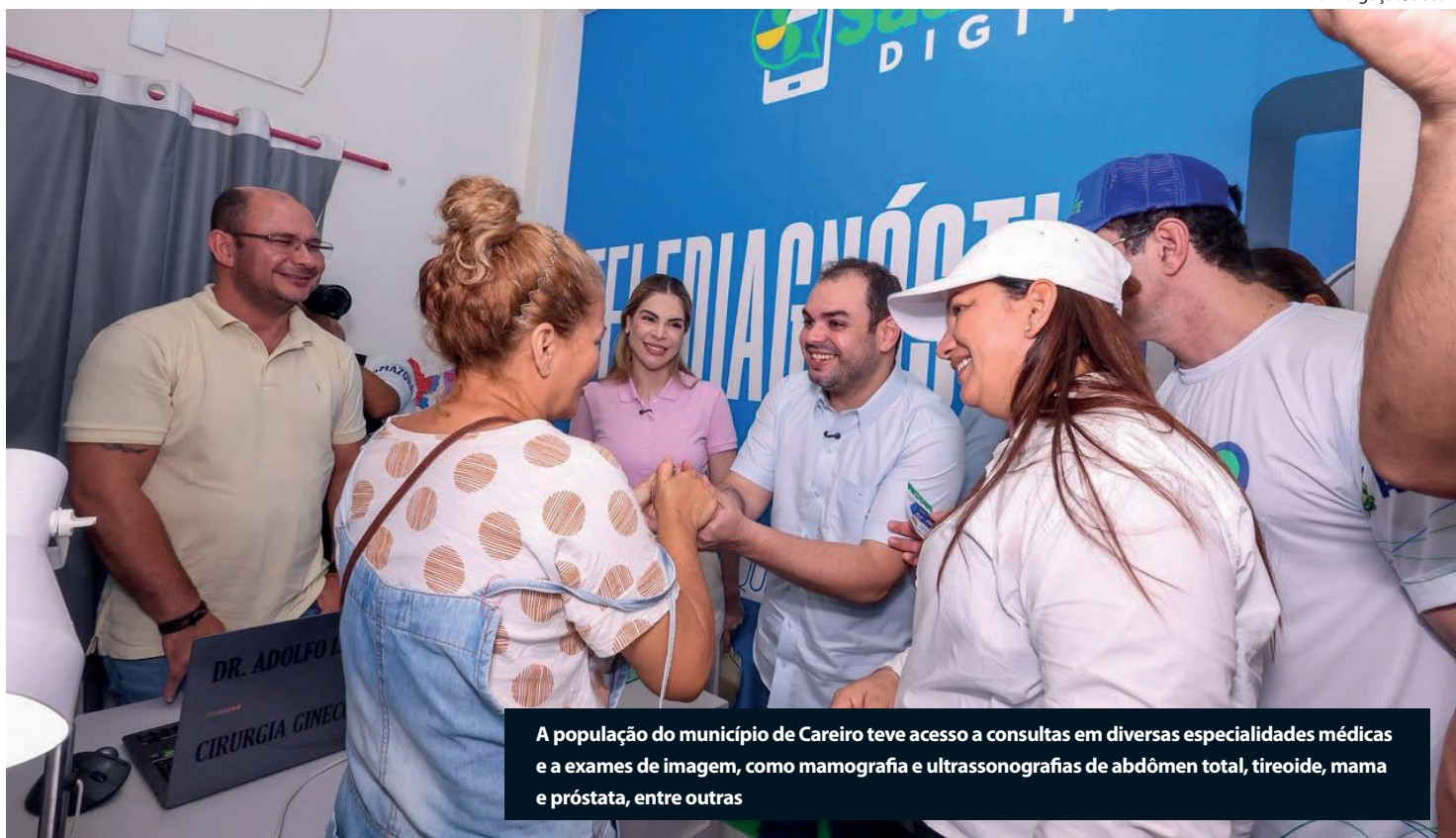
A população do município de Careiro teve acesso a consultas em diversas especialidades médicas e a exames de imagem, como mamografia e ultrassonografias de abdômen total, tireoide, mama e próstata, entre outras